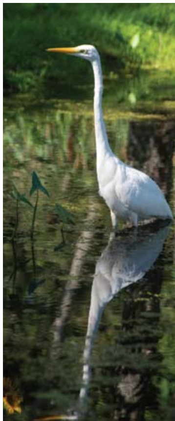
Šis didysis baltasis garnys buvo drąsiausias iš visų, mano matytų.

Ūgiu gal kiek didesnis už gandrą, tačiau už jį gerokai liesesnis ir lengvesnis ilgaka-