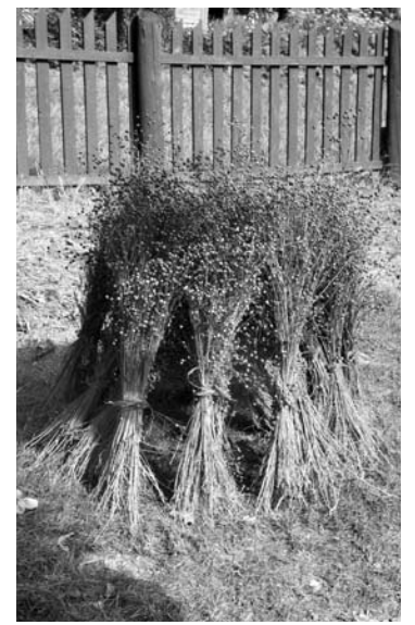
Iš linų laukelio muziejaus kiemelyje liko tik dailios gubos...

Pabendrauvę, pasišnekučiavę visi kibo į darbą. Linarūtė