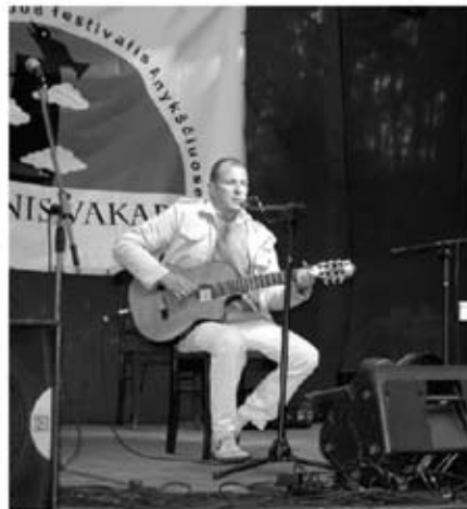
... o po to pats pasirodė scenoje.