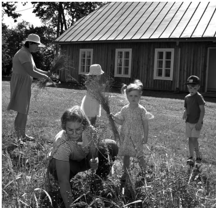
Linarūtės Kunigiškiuose prie muziejaus vaizdai.

Rūpestingai prižiūrimi linai augo, stiebėsi, bujojo, džiugino mėlynais žiedais. Ir atėjo diena,