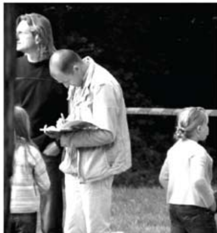
Režisierius, rašytojas Vytautas V.Landsbergis renginio metu dalino vaikams autografus...

Šeštadienį Dainuvos slėnyje vyko respublikinis bardų festivalis „Purpurinis vakaras“. Renginyje grojo ir dainavo daugiau nei dešimt atlikėjų.