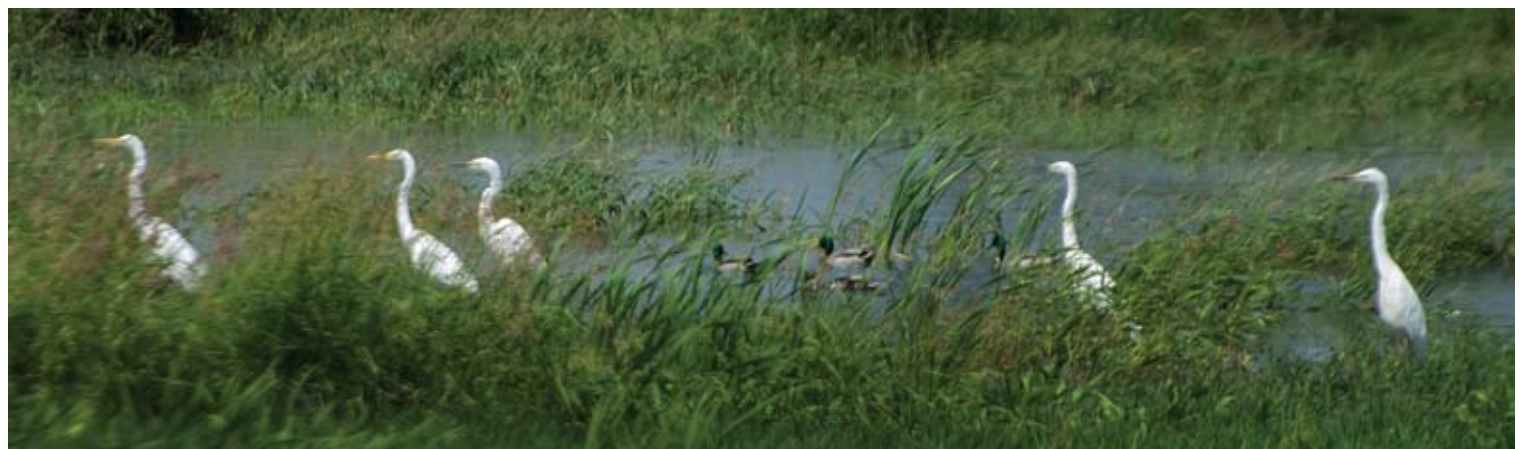
Garniai yra gandrinių šeimos paukščiai, tad irgi mėgsta būriuotis.