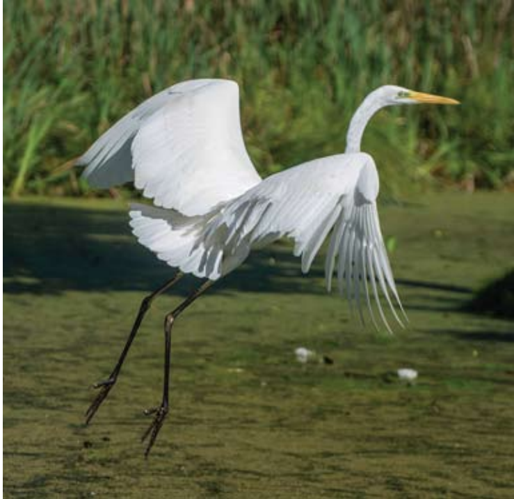
Baltųjų sparnų mostas siekia beveik du metrus.

Į tvenkinį Šventosios senvagėje, visai šalia namo, Elmos soduose, atskrido didysis baltasis garnys. Grakštus, kaip iš pieno plaukęs paukštis ilgom juodom kojom gamtoje yra baikštus ir atsargus, tačiau šį kartą tvenkinyje pasigavo tris žuvytes, visiškai nekreipdamas dėmesio į antis ir jį fotografantį žmogų.