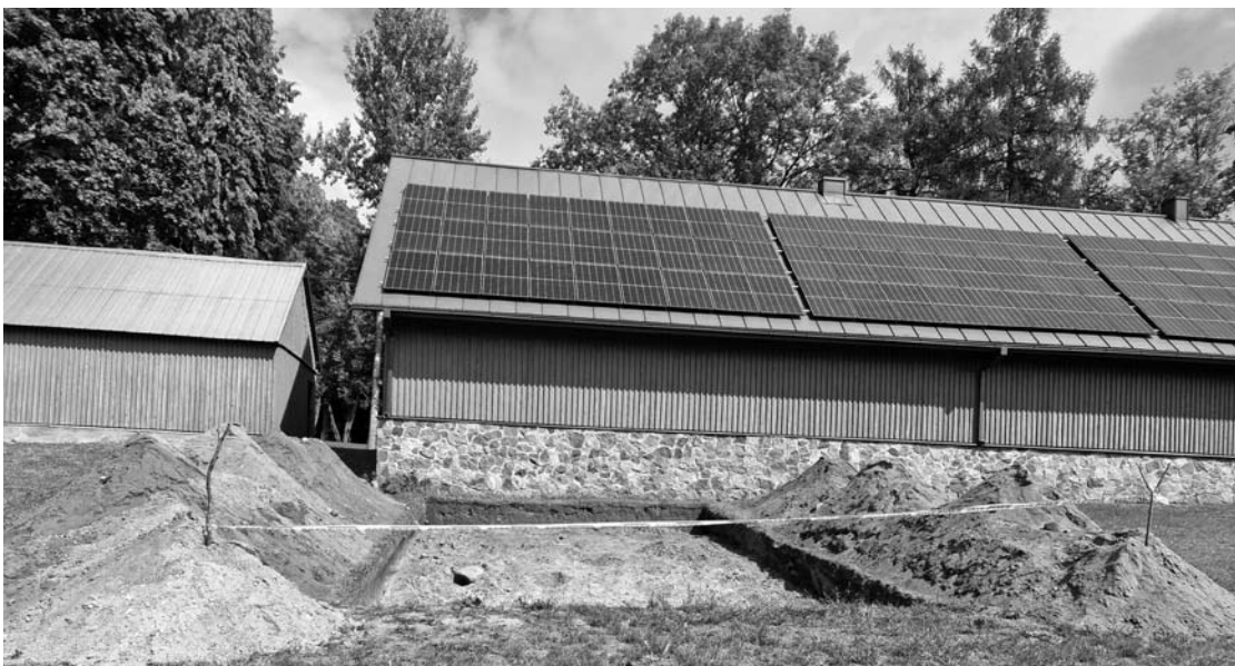
Mokslininkai atliko archeologinius tyrinėjimus 60 kv. m teritorijoje, šalia Anykščių menų inkubatoriaus.