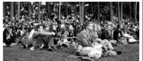
Kad būtų arčiau scenos, kai kurie žiūrovai pasitęsė ant žemės pledus.

Atiduriant renginį kalbėjo rajono meras Sigutis Obelevičius, kuris pakvietė visus norinčius ir galinčius už tai susimokėti, pasikraidyti oro balionu.