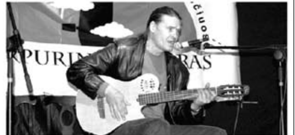
Aktorius Olegas Ditkovskis atliko klasika tapusias balades.